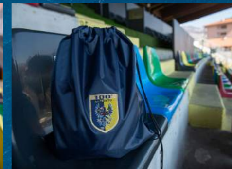
ZAINO SACCA AC TRENTO 1921 7.00 euro