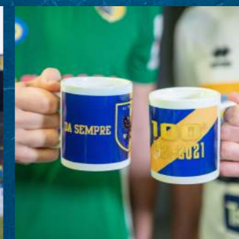
TAZZA AC TRENTO 1921 9.00 euro