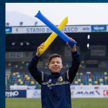
STICK RUMOROSI 3.00 euro (colori blu/giallo)