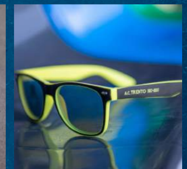
OCCHIALI AC TRENTO 1921 14.00 euro