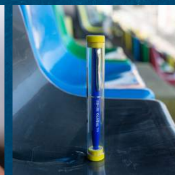
PENNA AC TRENTO 1921 5.00 euro