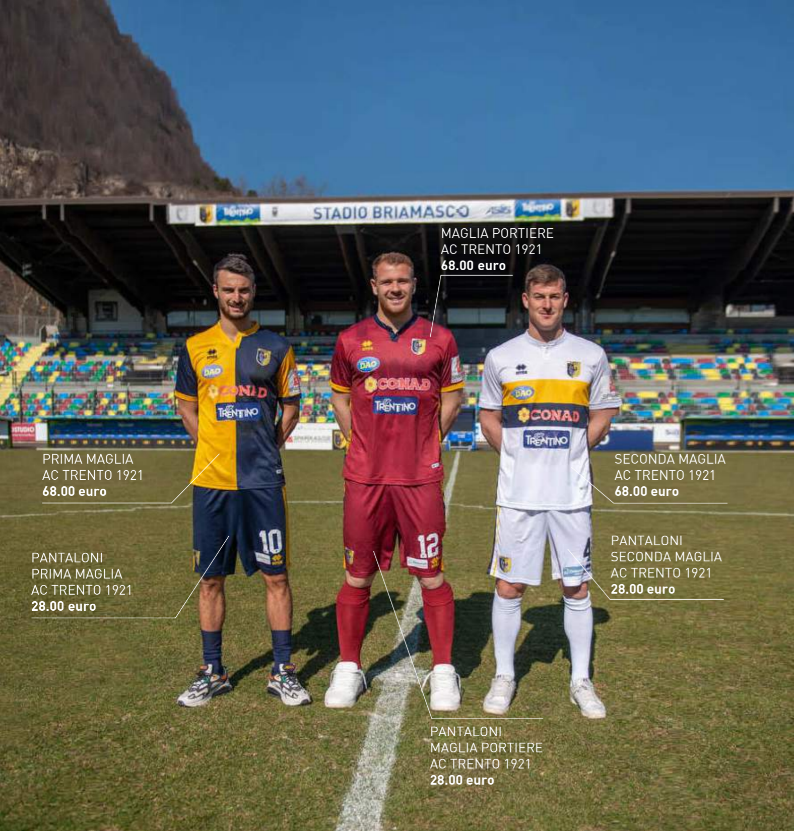
PRIMA MAGLIA AC TRENTO 1921 68.00 euro