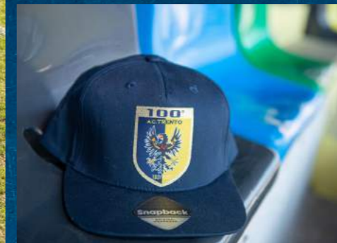
CAPPELLO AC TRENTO 1921 8.00 euro