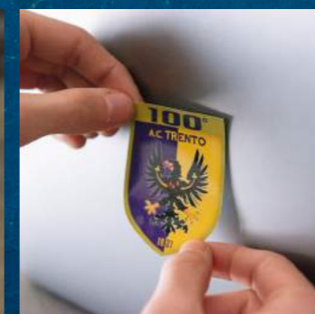
KIT ADESIVI AC TRENTO 1921 6.00 euro