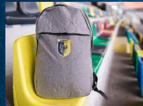
ZAINO AC TRENTO 1921 25.00 euro