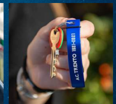
PORTACHIAVI APRIBOTTIGLIA 4.00 euro