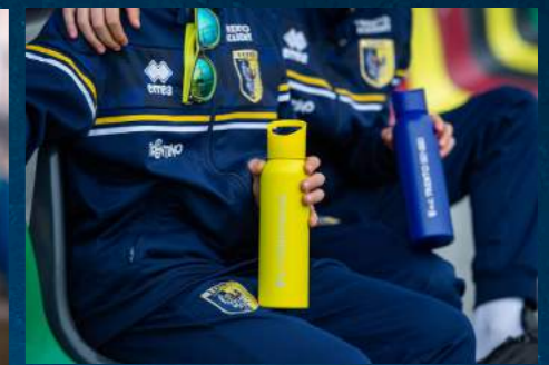
BORRACCIA AC TRENTO 1921 9.00 euro (colori blu/giallo)