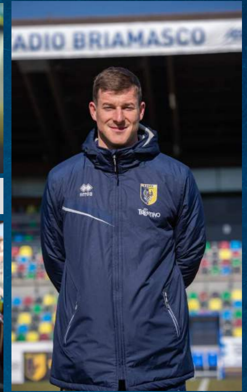
GIACCA AC TRENTO 1921 48.60 euro