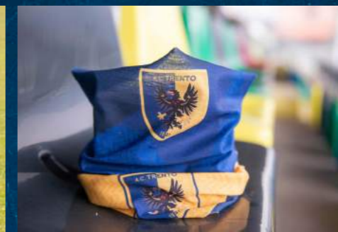
SCALDACOLLO AC TRENTO 1921 8.00 euro