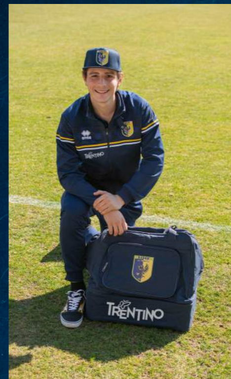
BORSONE AC TRENTO 1921 30.05 euro