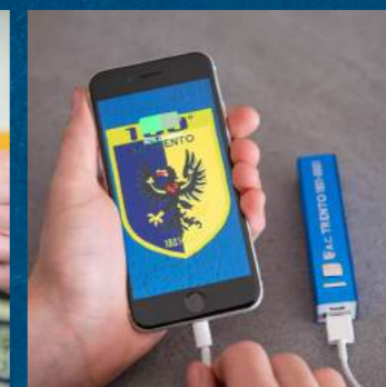
POWEBANK AC TRENTO 1921 13.00 euro