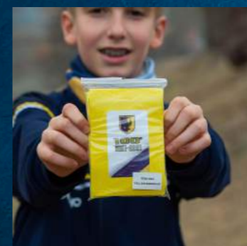
PONCHO AC TRENTO 1921 3.00 euro